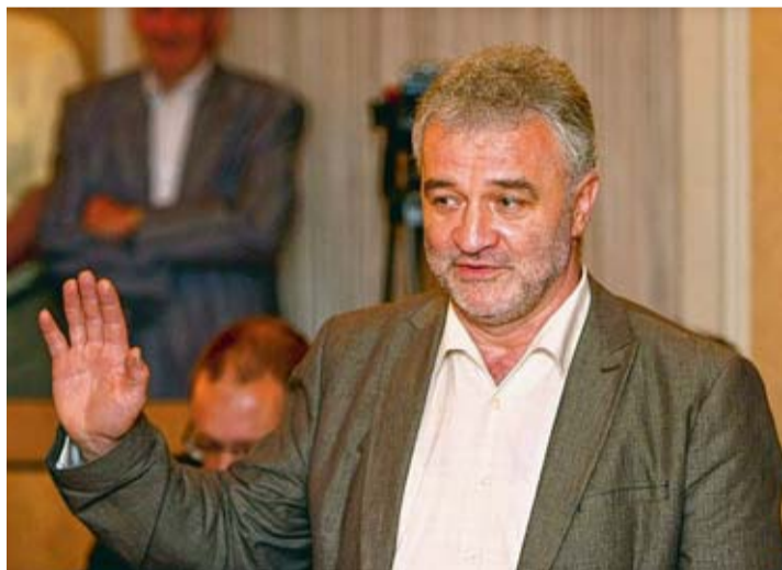
Le socialiste écrit toutes ses questions lui-même.

Mais comment fait-il pour trouver autant de questions à poser ? « Je discute énormément avec des experts, des spécialistes, qui attirent mon attention sur des points très concrets. Que ce soit en matière d'aménagement du territoire, de logement ou encore d'énergie notamment. Il est parfois néces-