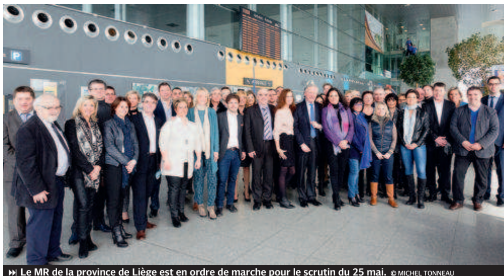
► Le MR de la province de Liège est en ordre de marche pour le scrutin du 25 mai.