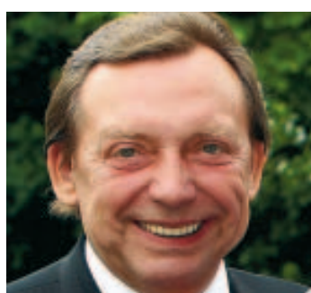
15e candidat effectif.

> Sa position: il était 15e candidat effectif liste PS. > Voix de préférence: en 2010: + de 60.000 en 2007: 92.922 voix. > Carte d'identité: bourgmestre de la commune d'Ans, ministre fédéral sortant des Pensions et de la Politique des Grandes Villes. Il a aussi été vice-président du Gouvernement wallon en charge du Budget, des Finances et de l'Équipement. «