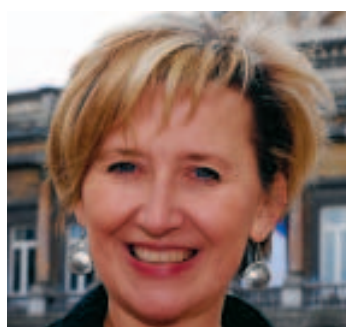
Marie-Dominique Simonet. ■ C.H.

> Sa position: 2 e candidate effectif sur la liste cdH > Voix de préférence: en 2010: en 2007: 21.482 voix > Carte d'identité: Ministre de l'Enseignement obligatoire et de Promotion sociale, députée sur la liste cdH à la Chambre en Province de Liège, députée sur la liste cdH à la Région et conseillère communale à Esneux.