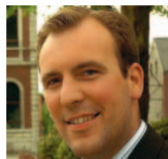
Tête de liste du cdH.

> Sa position: le Verviétois était tête de liste du cdH. > Voix de préférence: en 2010: en 2007: 28.538 voix. > Carte d'identité: conseiller communal à Verviers, député fédéral en 2007, Secrétaire d'État sortant au Budget et à la Politique des Familles au sein du gouvernement Leterme 1er puis au sein du gouvernement Van Rompuy. «