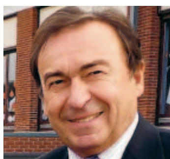
Bourgmestre de Waremme. ■ E.V.

> Sa position: 3 ème candidat effectif sur la liste PS. > Voix de préférence: en 2010: en 2007: 29.126 voix > Carte d'identité: bourgmestre de Waremme depuis 2006, Guy Coëme est aussi membre de la Chambre des Représentants. En 1992, il était vice-Premier Ministre et Ministre des Communications et des entreprises publiques.