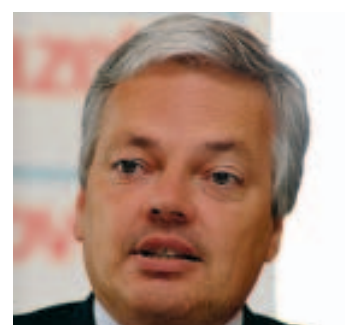
Tête de liste MR.

> Sa position: tête de liste du MR. > Voix de préférence: en 2010: en 2007: 102.762 voix > Carte d'identité: Didier Reynders est Vice-Premier Ministre et Ministre des réformes institutionnelles, Ministre des Finances en charge de la Régie des Bâtiments et Président du Mouvement Réformateur.