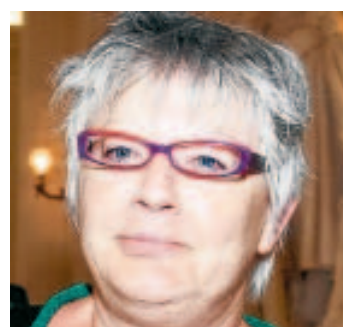
Tête de liste Ecolo.

> Sa position: tête de liste Ecolo en province de Liège. > Voix de préférence: en 2010: en 2007: 14.866 voix. > Carte d'identité: députée fédérale sortante depuis 1999, présidente de la Commission Santé puis 2007, présidence qu'elle a cessé lorsqu'elle est devenue chef de groupe Ecolo-Groen! à la Chambre des Représentants depuis juin 2009. «