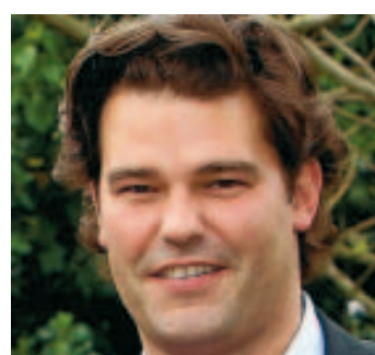
Tête de liste PS.

> Sa position: tête de liste PS en province de Liège. > Voix de préférence: en 2010: en 2007: 24.574 voix. > Carte d'identité: bourgmestre de Seraing depuis octobre 2006, député fédéral depuis 2003, actif au parlement fédéral principalement au sein de la commission "Finances" avec la lutte contre la "grande fraude fiscale" comme fer de lance. «