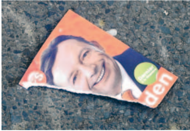
Tout le monde n'aime pas papa!