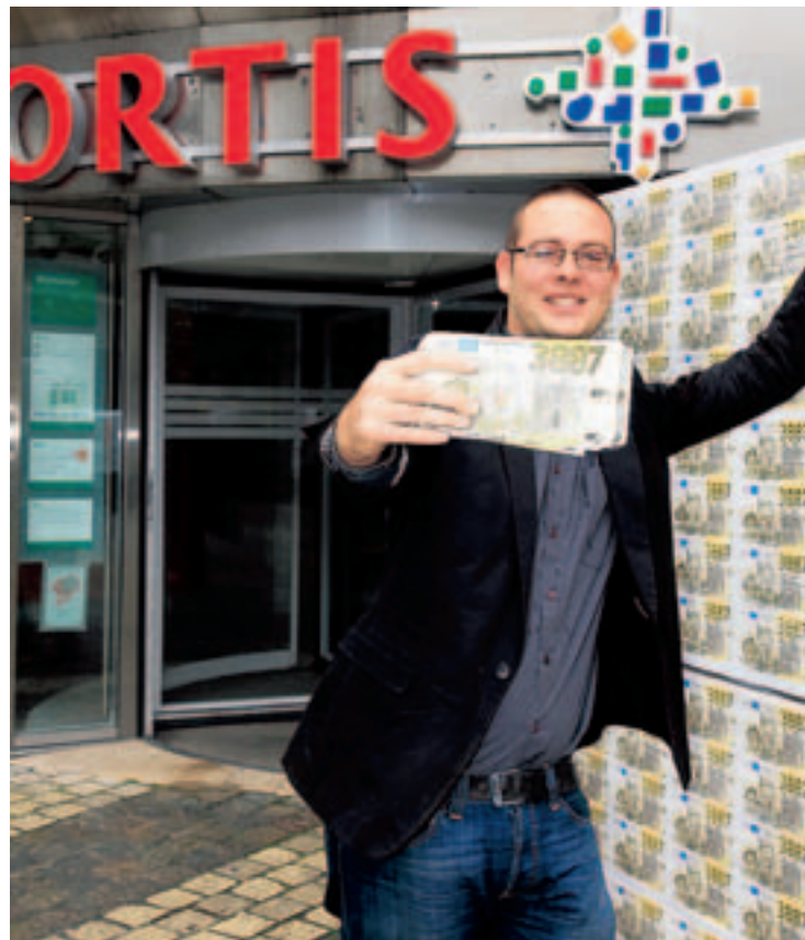
LE PTB+ renforce ses positions à Liège, Seraing et Herstal. Il espère un élu au conseil communal de Liège en 2012.

Musique endiablée, visages partout souriants et pompes à bière fort sollicitées : c'était à nouveau la fête à La Brasse , le local du PTB+, place Saint-Léonard, ce dimanche. Logique : après le PS, le PTB+ est le parti qui progresse le plus (et à peu près partout) par rapport à 2007.